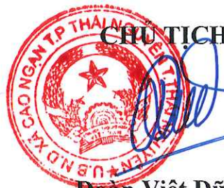
Đoàn Việt Dũng